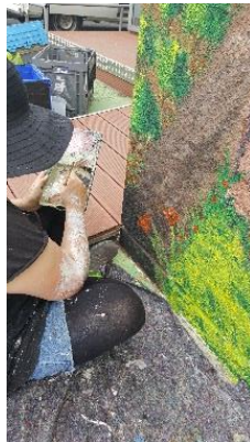
Rajout de fleurs non présentes sur la maquette.