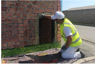
Travail sur l'ouverture de la porte...

... ainsi que sur les fissures du mur et les ombrages sur les briques.