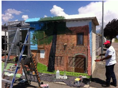
La maison traditionnelle occitane ainsi que le pin prennent forme.